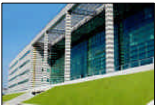
VEGA, PARCO SCIENTIFICO TECNOLOGICO

Stiamo vivendo una fase storica marcata dal passaggio epocale a una nuova Società dove il confine di Marghera “va oltre” e si perde nel globale.