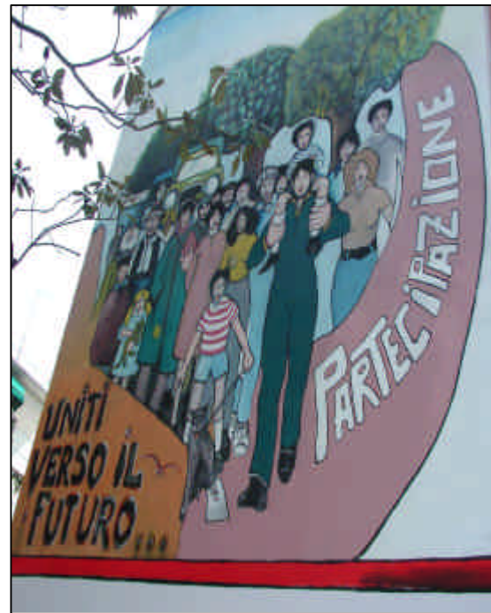
MUNICIPIO DI MARGHERA MURALES DIPINTO SULLA FACCIATA PRINCIPALE

Marghera esprime da sempre una forte tradizione partecipativa democratica dove crescono persone, professioni, socialità, ... dove si fondono idee, culture e materie.