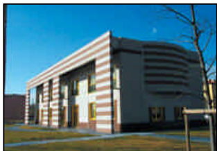
NUOVA SEDE MUNICIPALITA' VI A RINASCITA